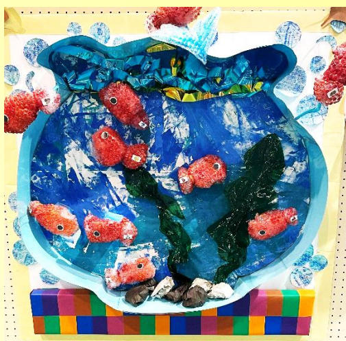
タイトル『わたしたちのきんぎょをさがせ！』