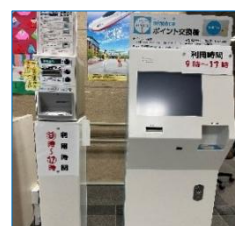
ニモカ ポイント交換機