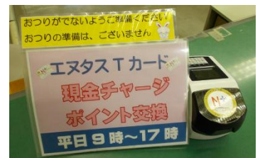
エヌタスカード ポイント交換機