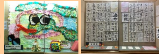
いちごの家 しんりゅうかい