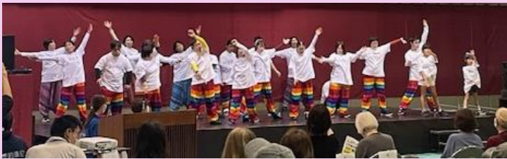
バンビーズ ダンス