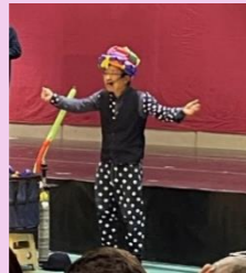
SHU-N バルーンパフォーマンス