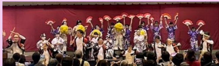
バタフライ フィーリングアートダンス