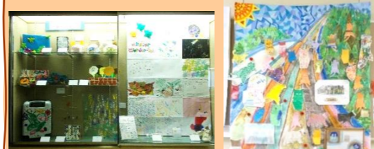
ゆうほ 遊歩の会 つどい・やまぼうし