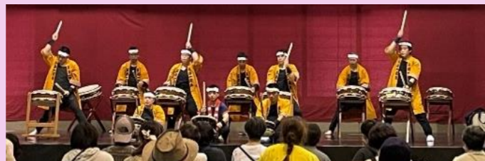
いっしんだいこ 長崎一心太鼓 和太鼓演奏