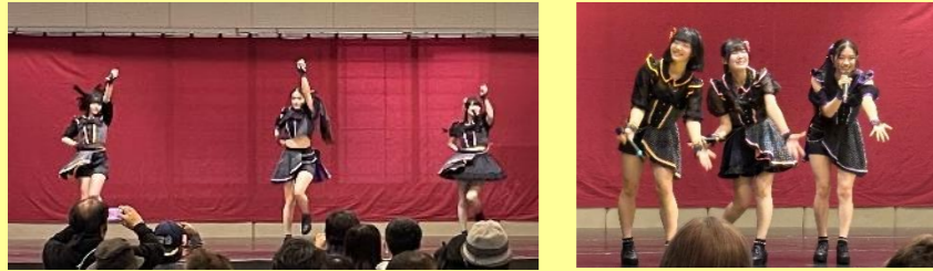
Milk Shake (ミルクセーキ) ライブ