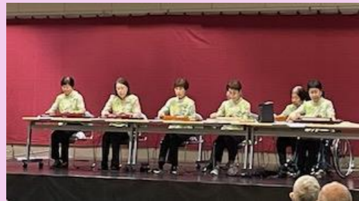
たすげの会 大正琴の演奏