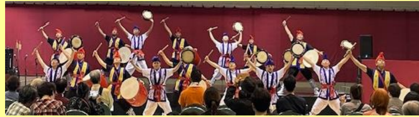
瓊浦高等学校 エイサーと和太鼓の演舞・演奏