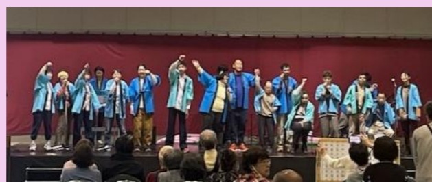
あおぞら 歌・ダンス・合奏