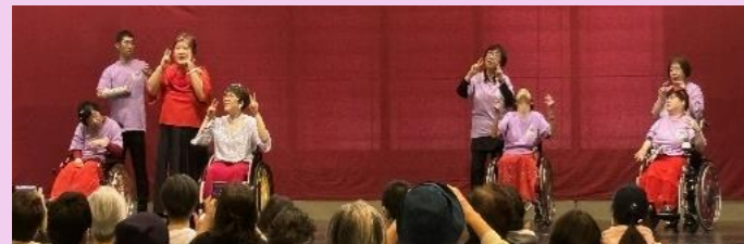
長崎フレンズ 車椅子ダンス