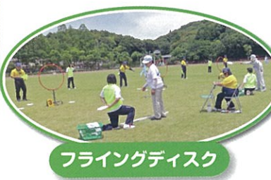
フライングディスク